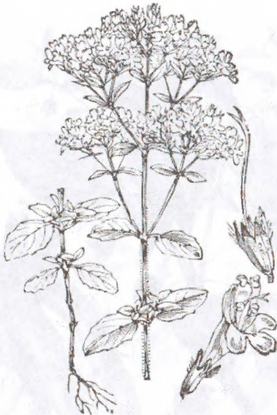
Origanum vulgare L.