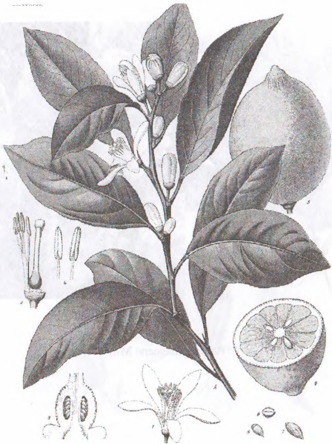
Citrus limon Burn