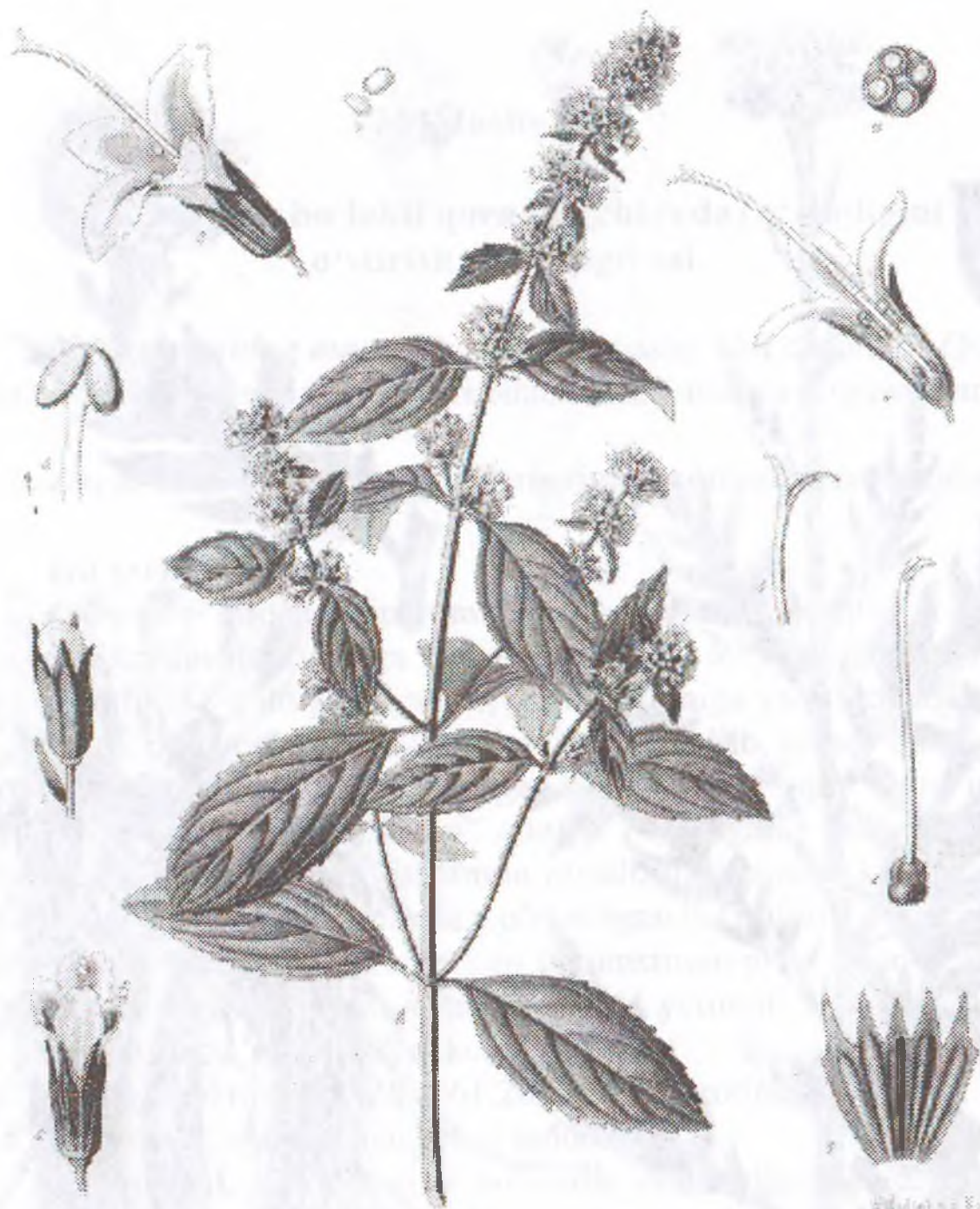
Menthe piperite L.