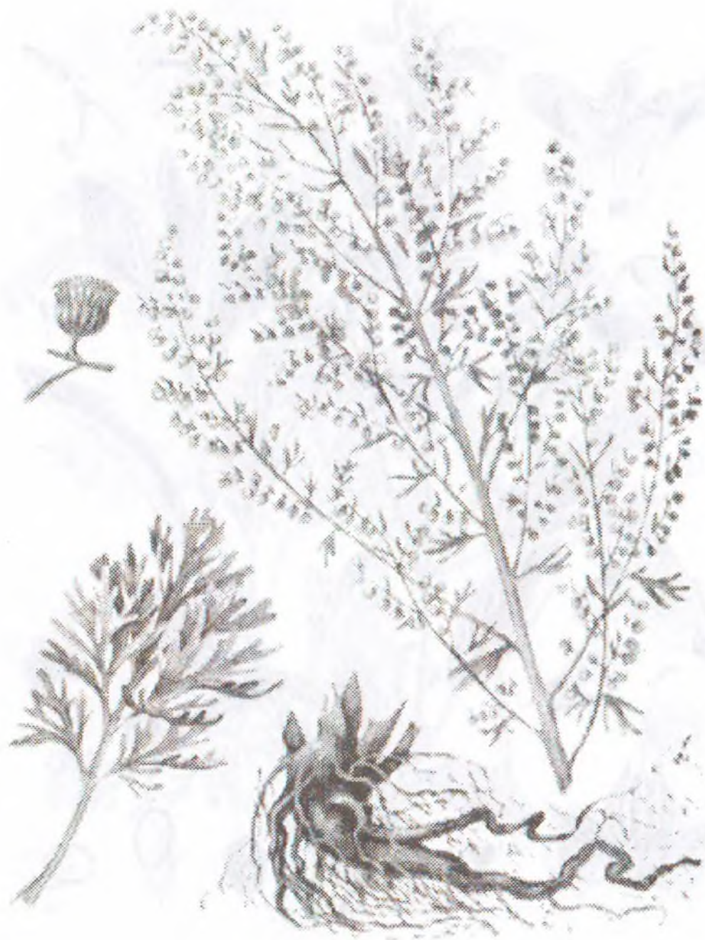
Artemisia absinthium L.