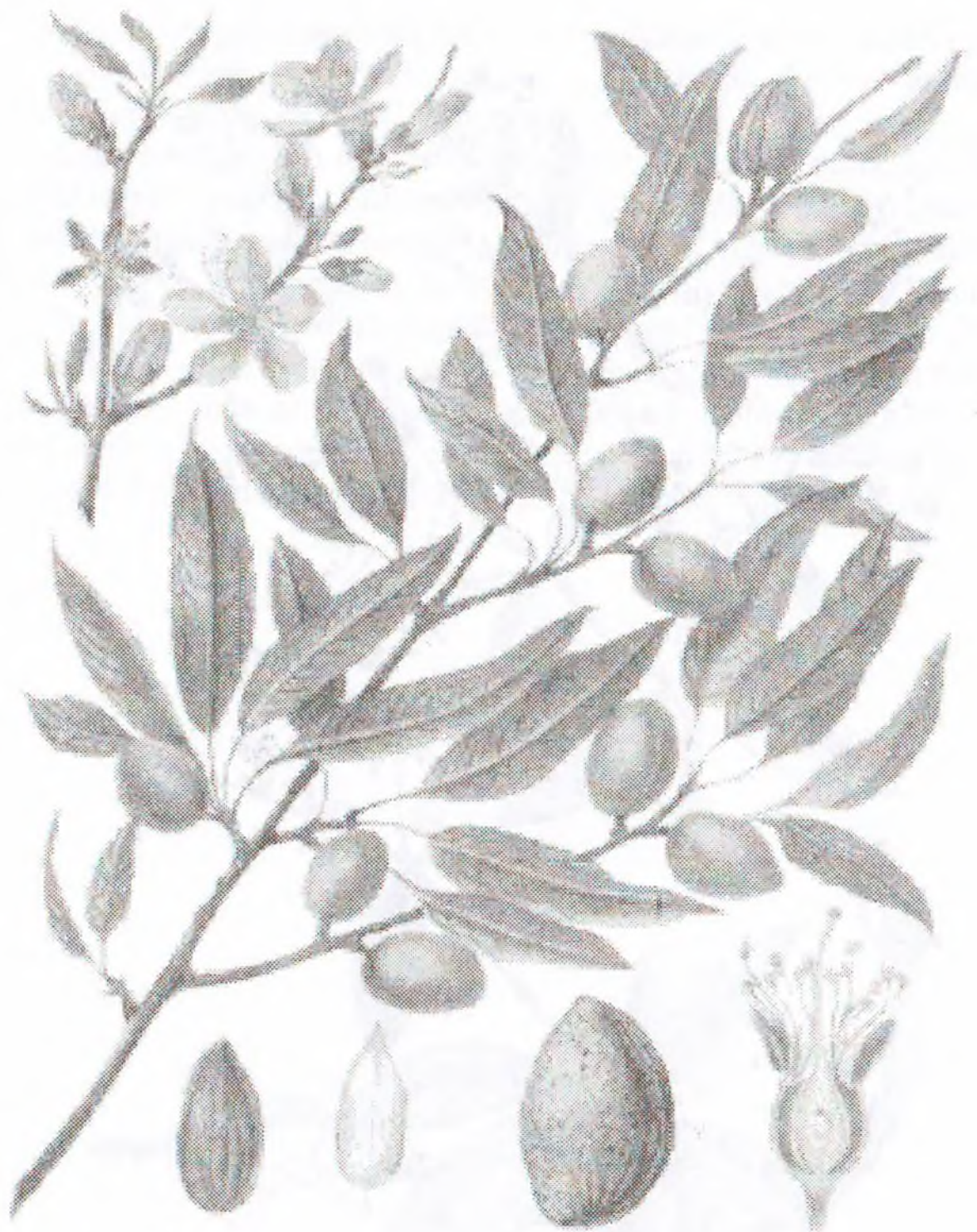
Amygdalus communis L.