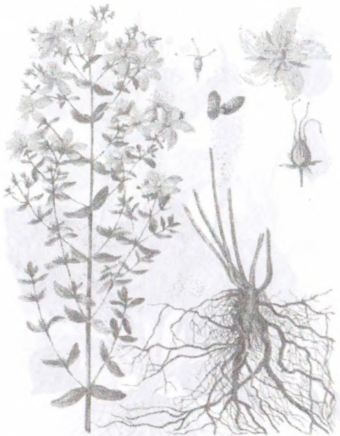
Hypericum perforatum L.