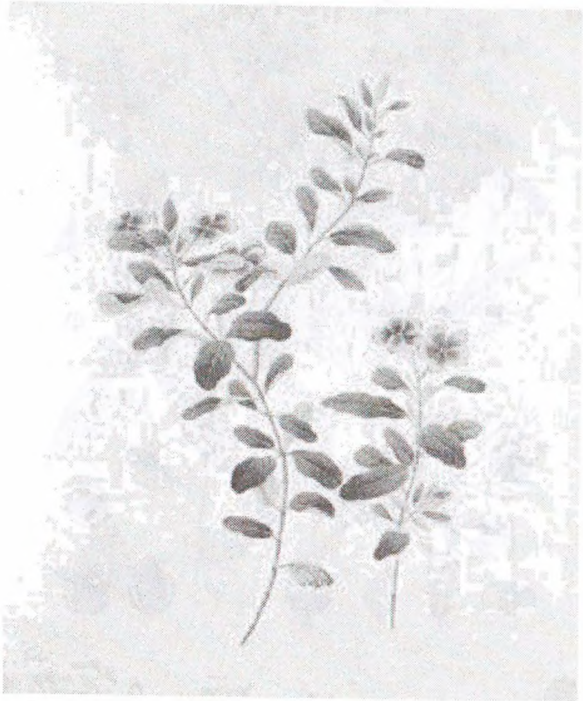
Catharanth roseus (L.).G. Don. ( Vinca rosea L.)