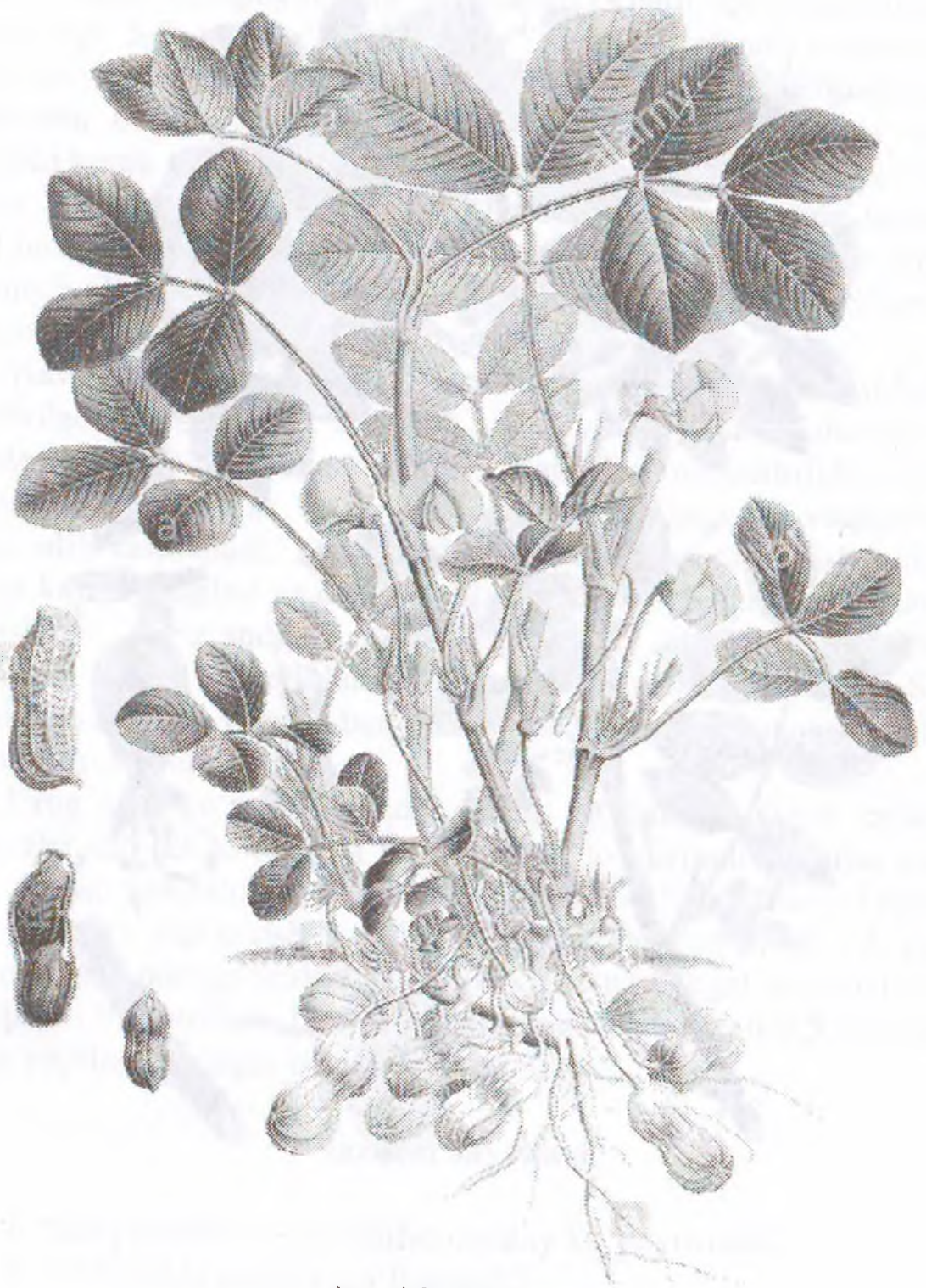
Arachis hypogaea L.