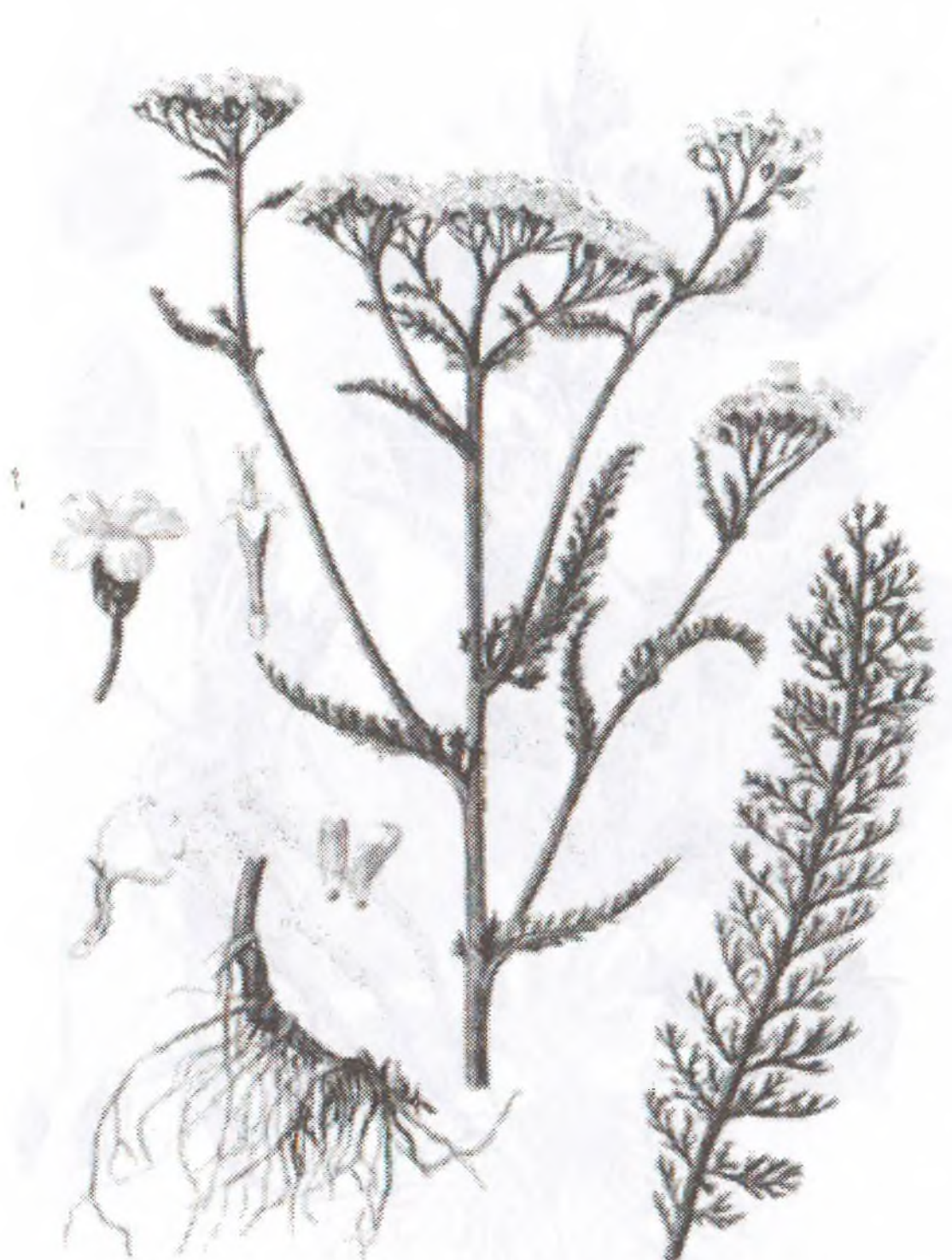
Achillea millefolium L.