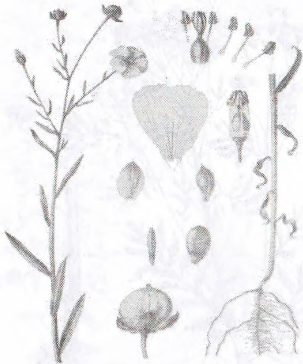
Linum usitatissimum L. s. 1.