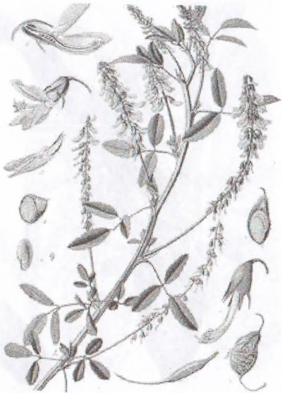
Melilotus officinalis (L) Desr.