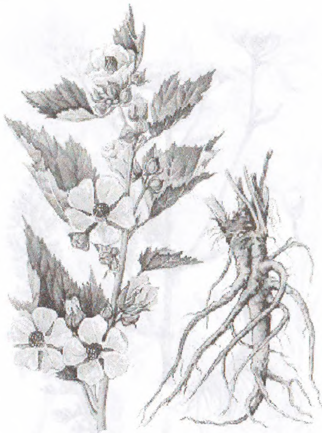
Alchaea officinalis L.