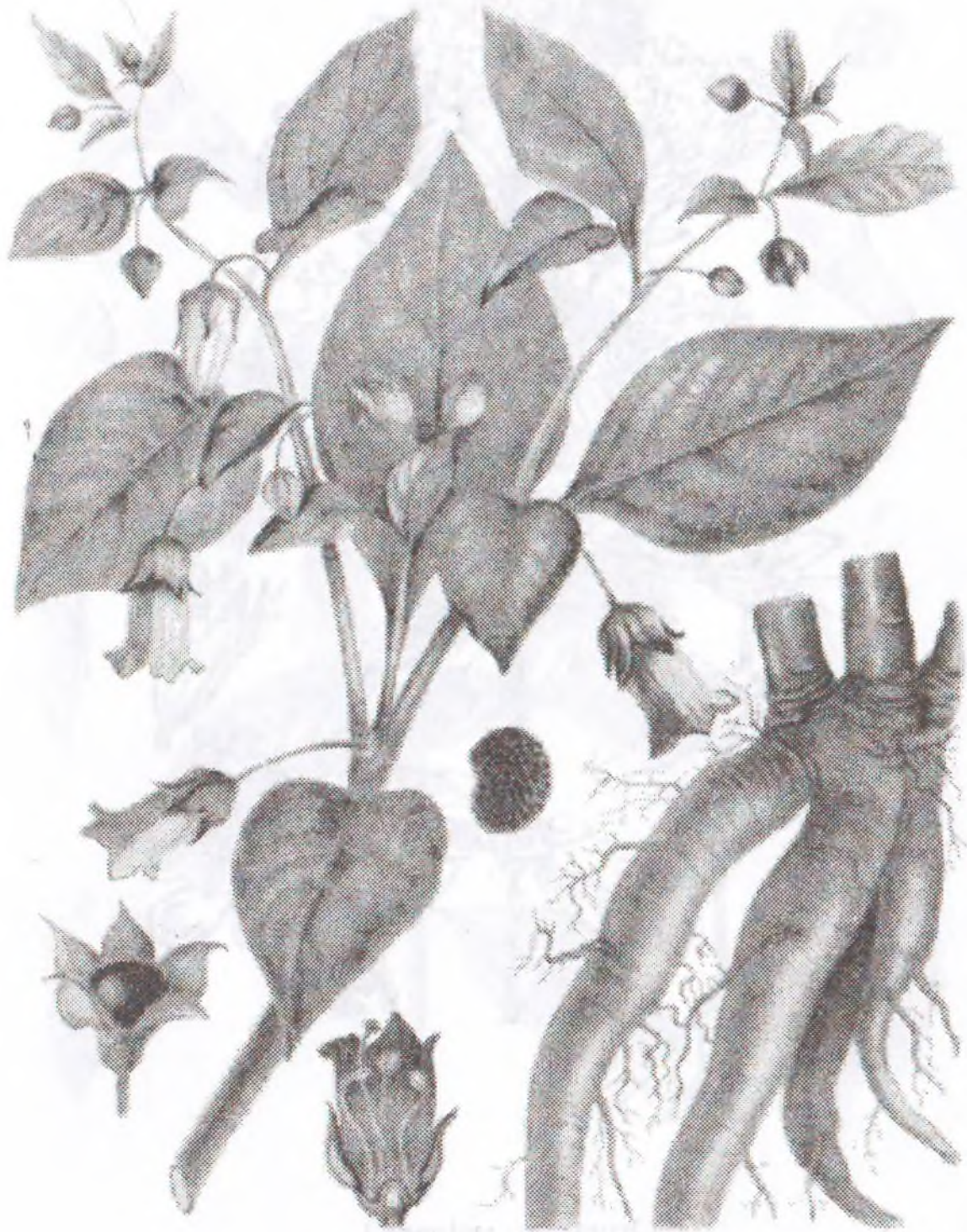
Atropa belladonna L.