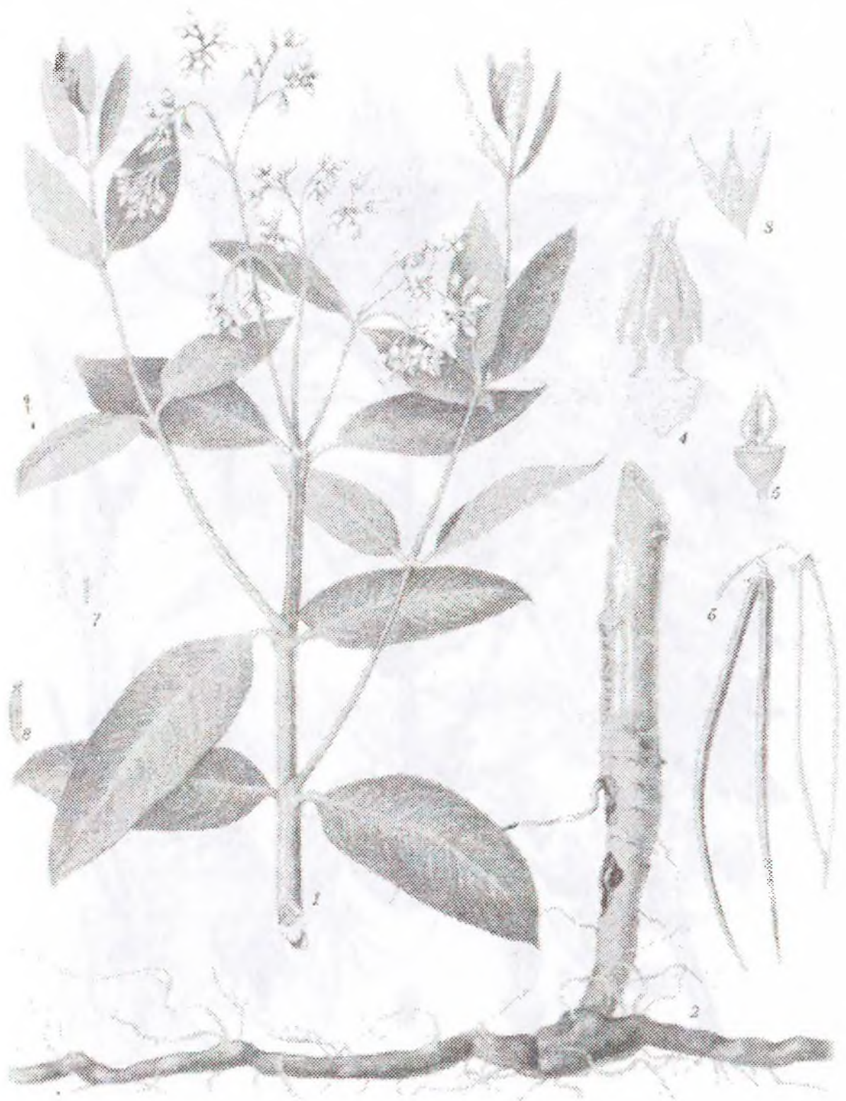
Apocynum cannabinum L.