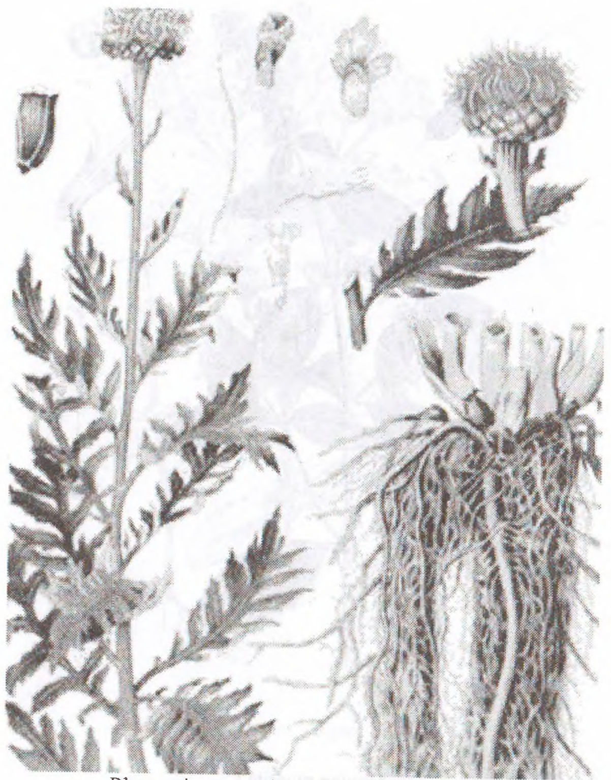
Rhaponti cum carthamoides (Villd.) Iljin.