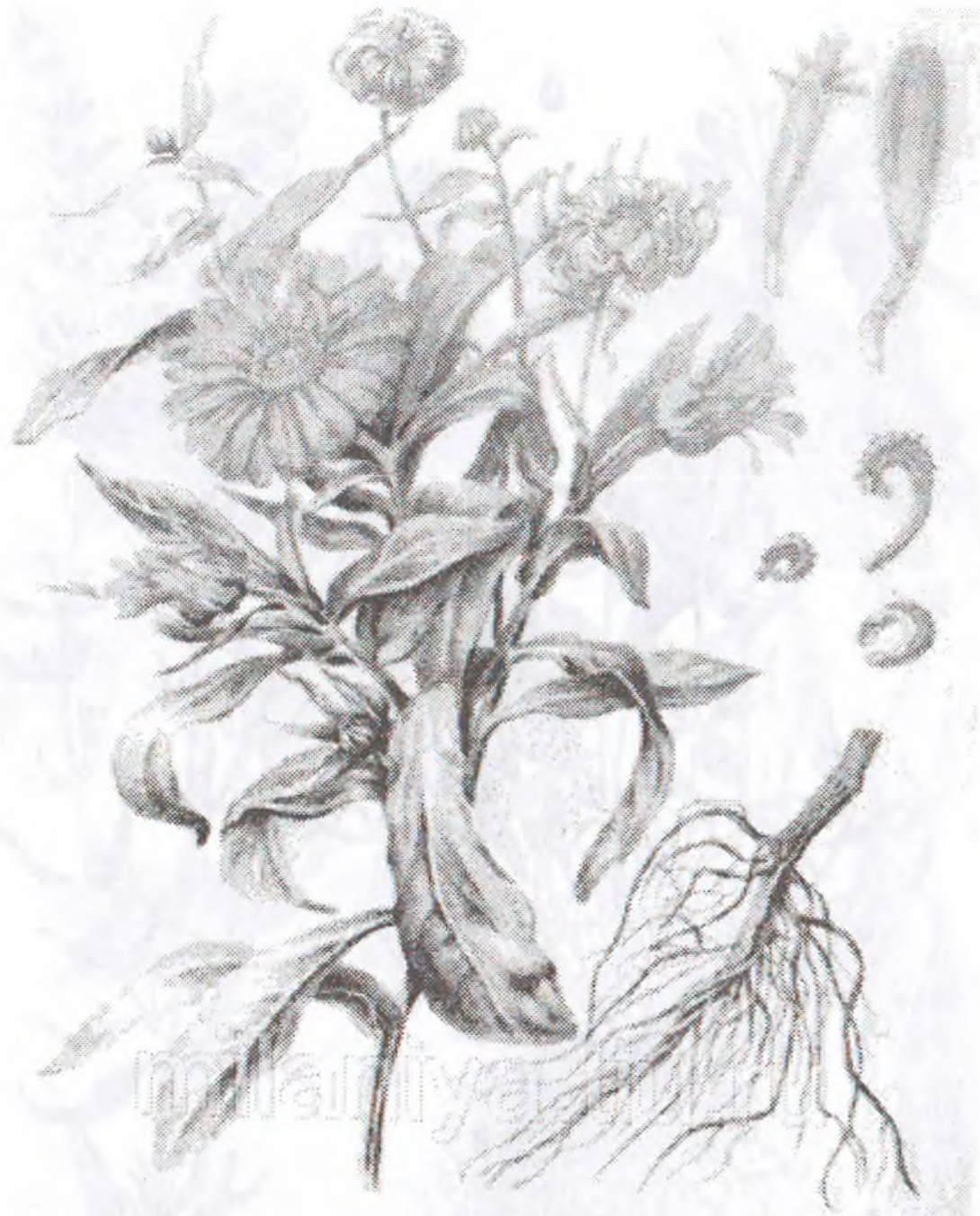
Calendula officinalis L.