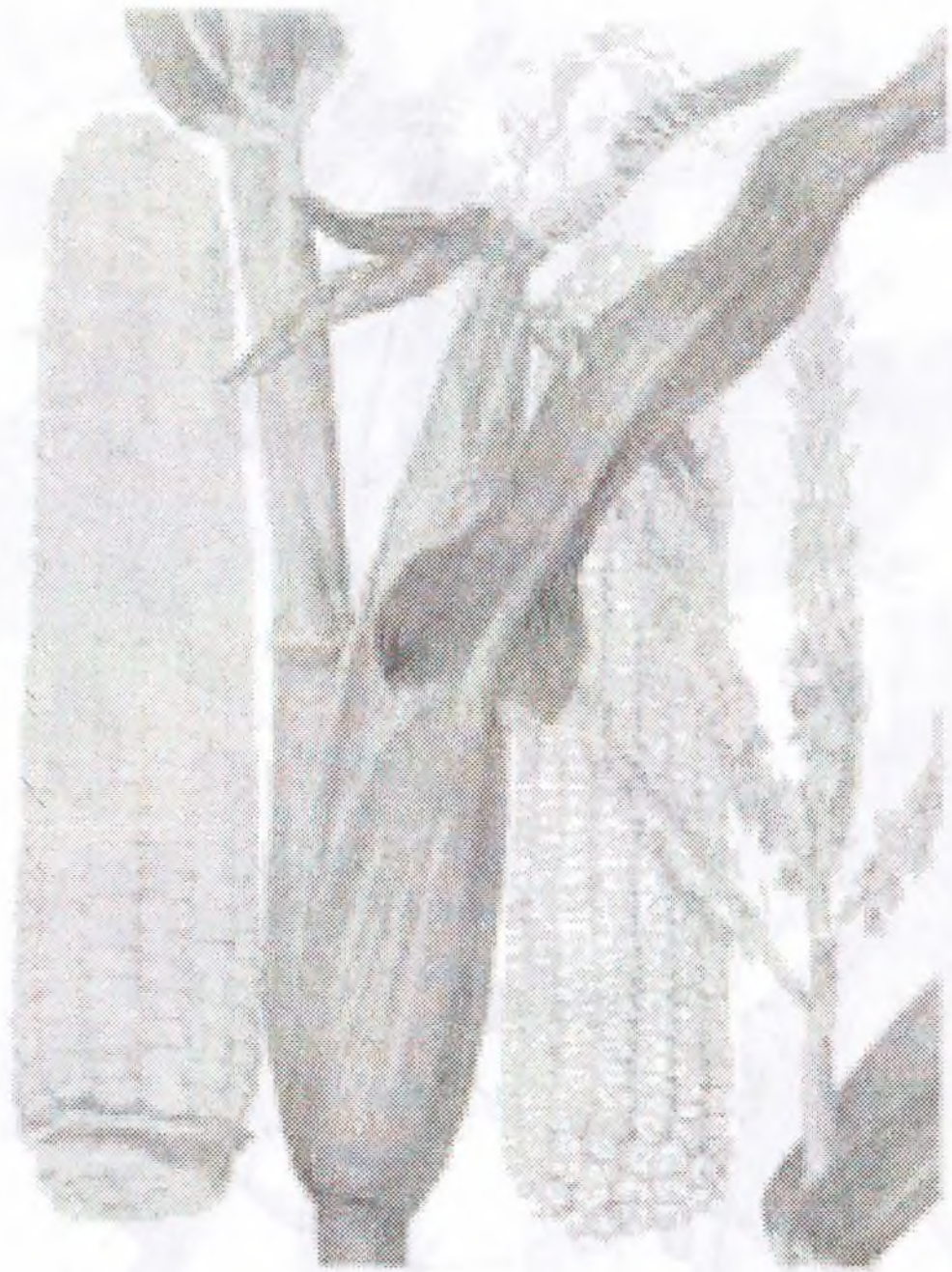
Passiflora incarnate L.