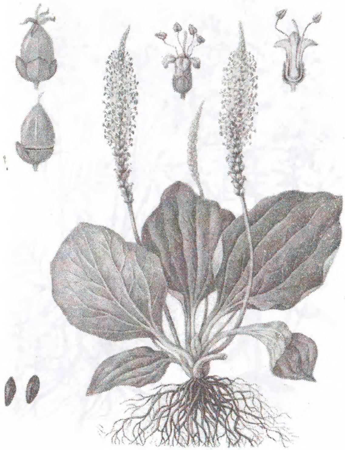
Plantago major L.