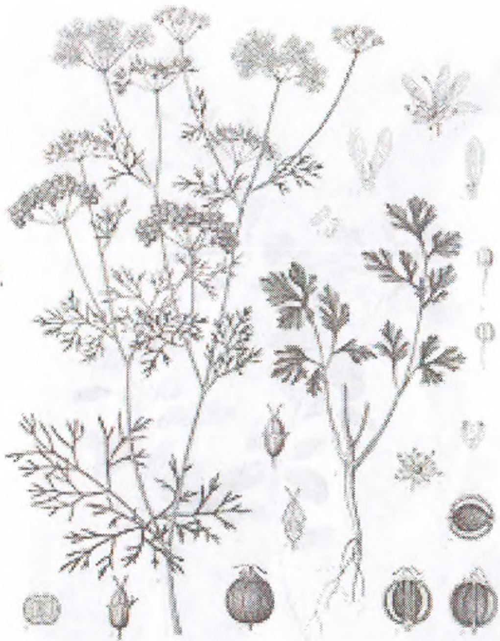
Coriandrum sativum L.