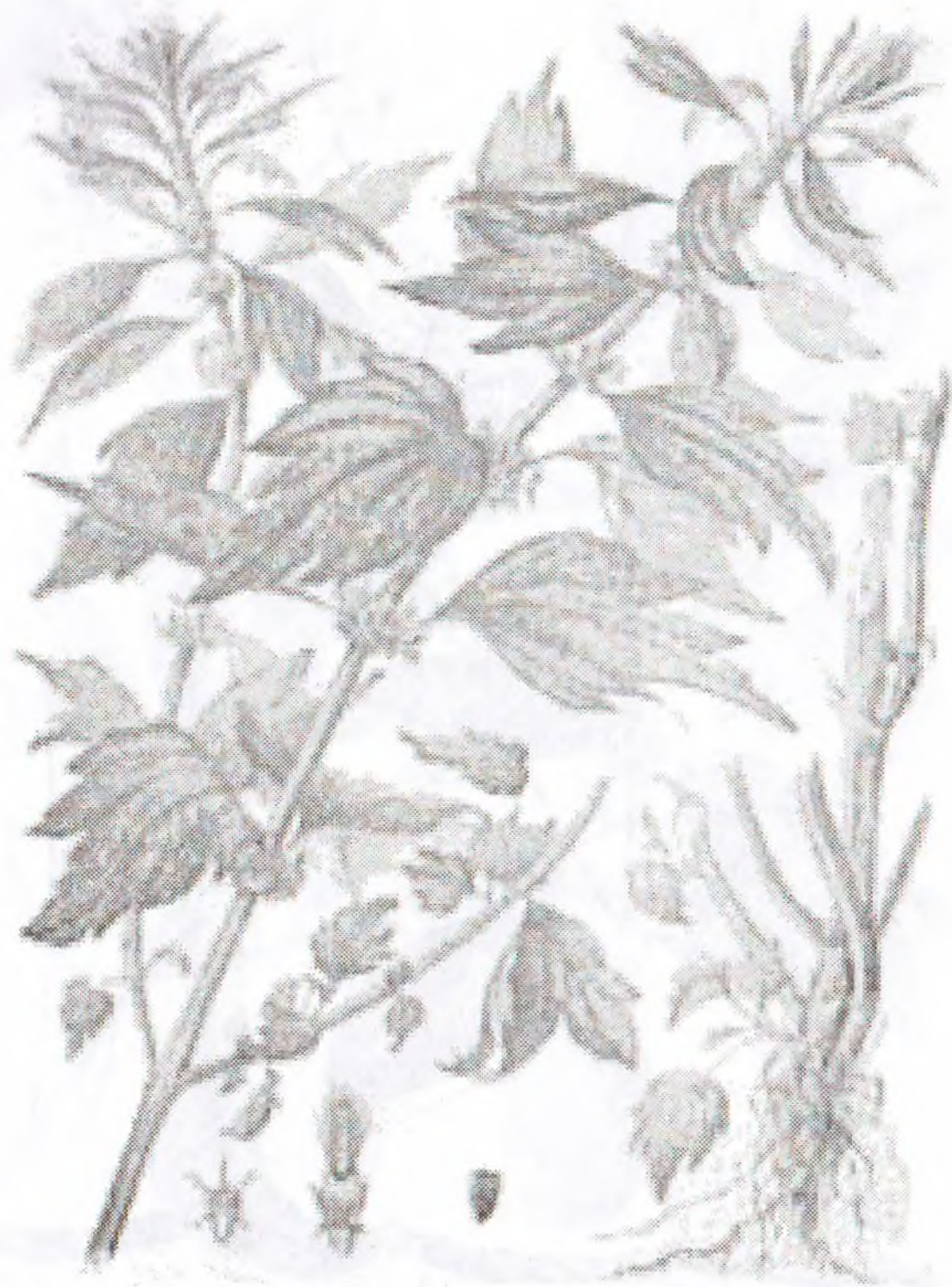
Leonurus quinquelobatus Gilib.