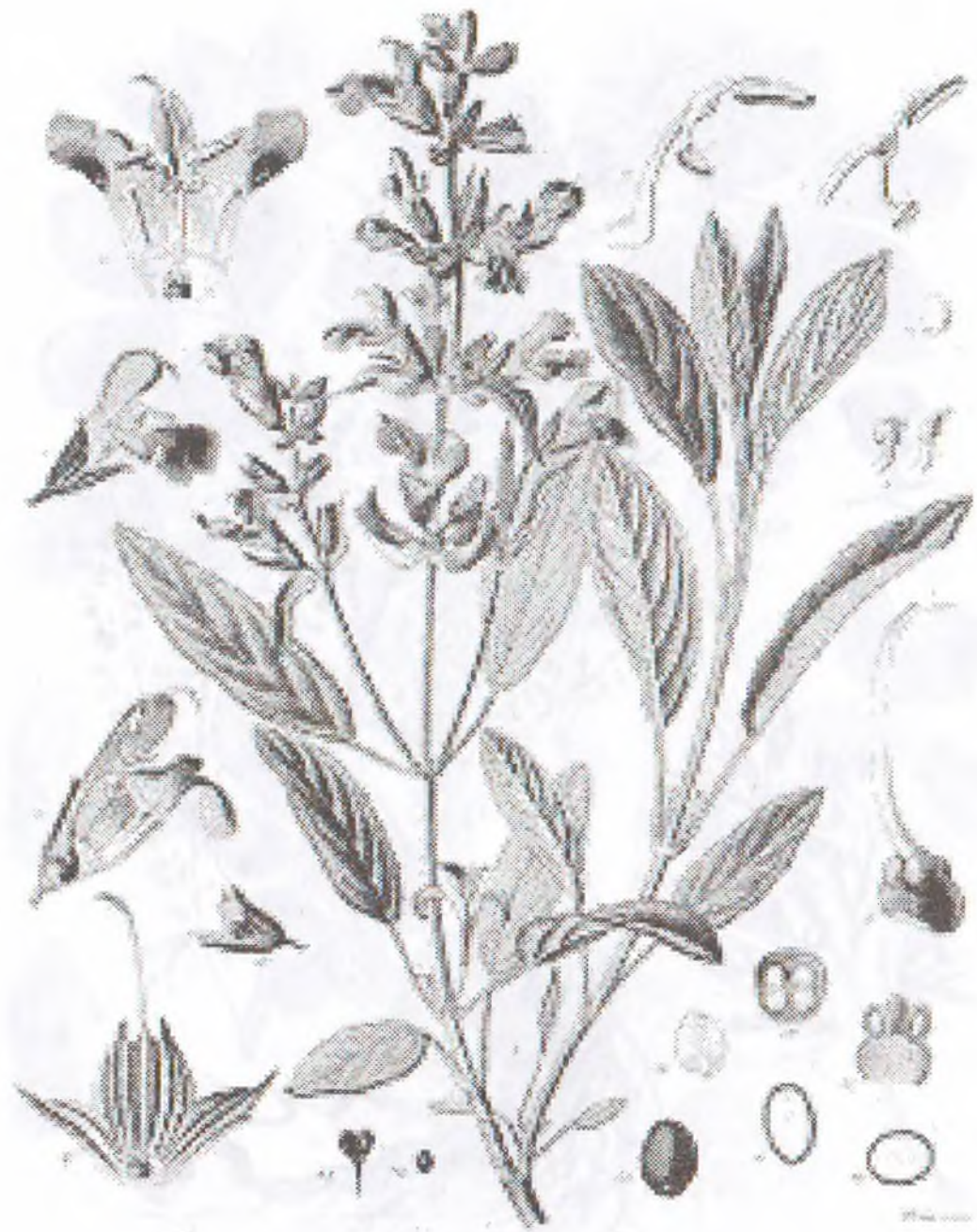
Salvia officinalis L.