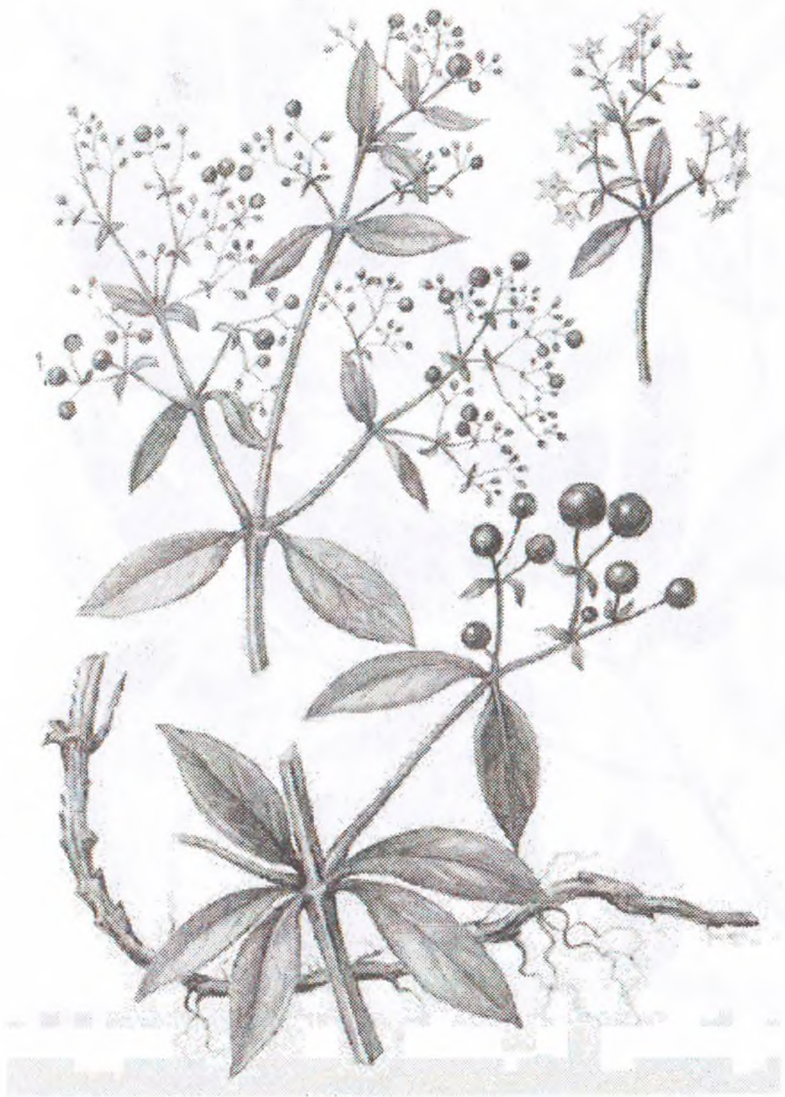
Rubia tinctorum L.