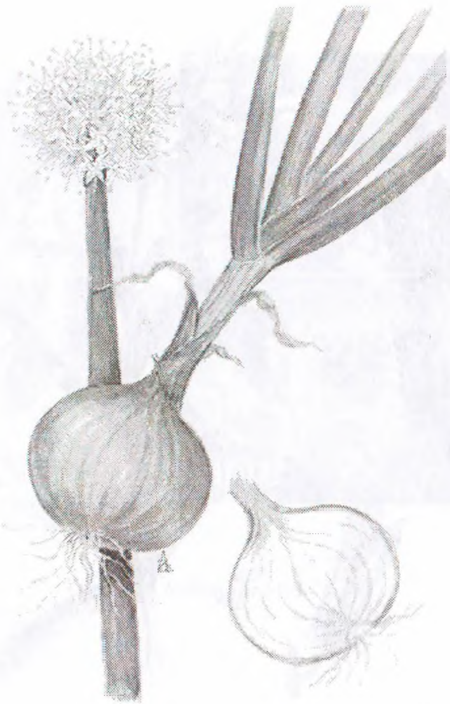
Allium cepa L.