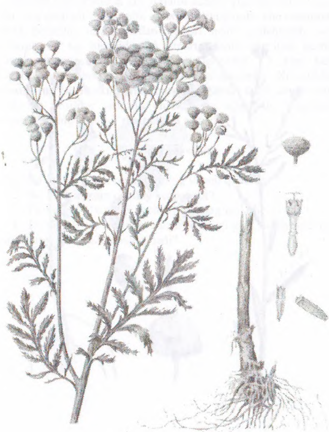
Tanacetum vulgare L.