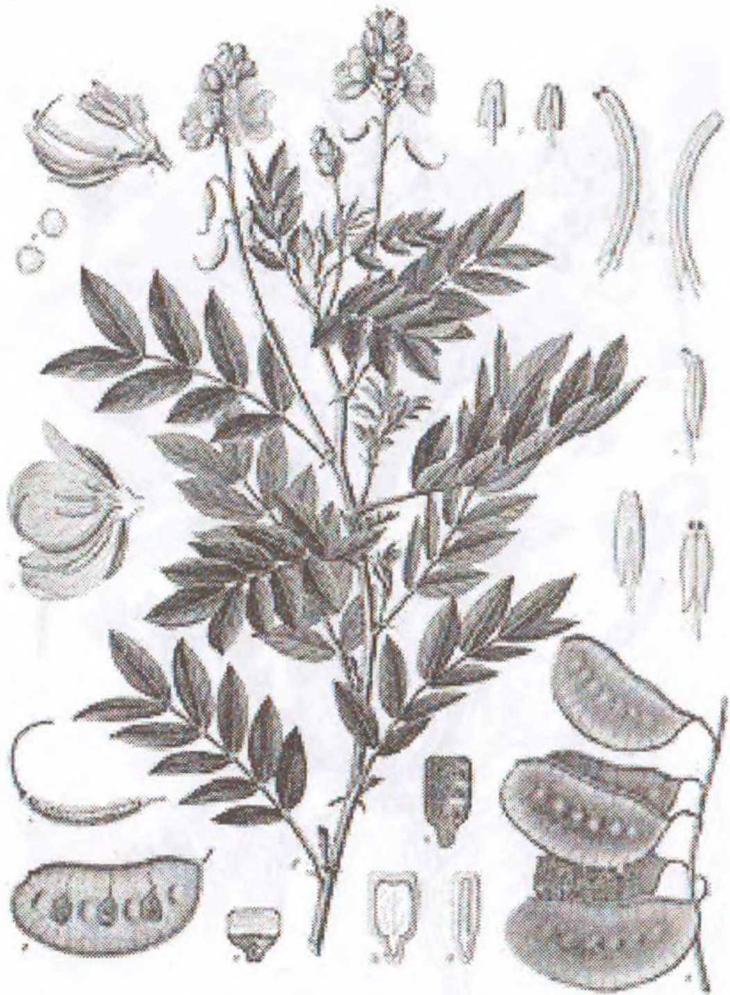
Cassia acutifolia Del.