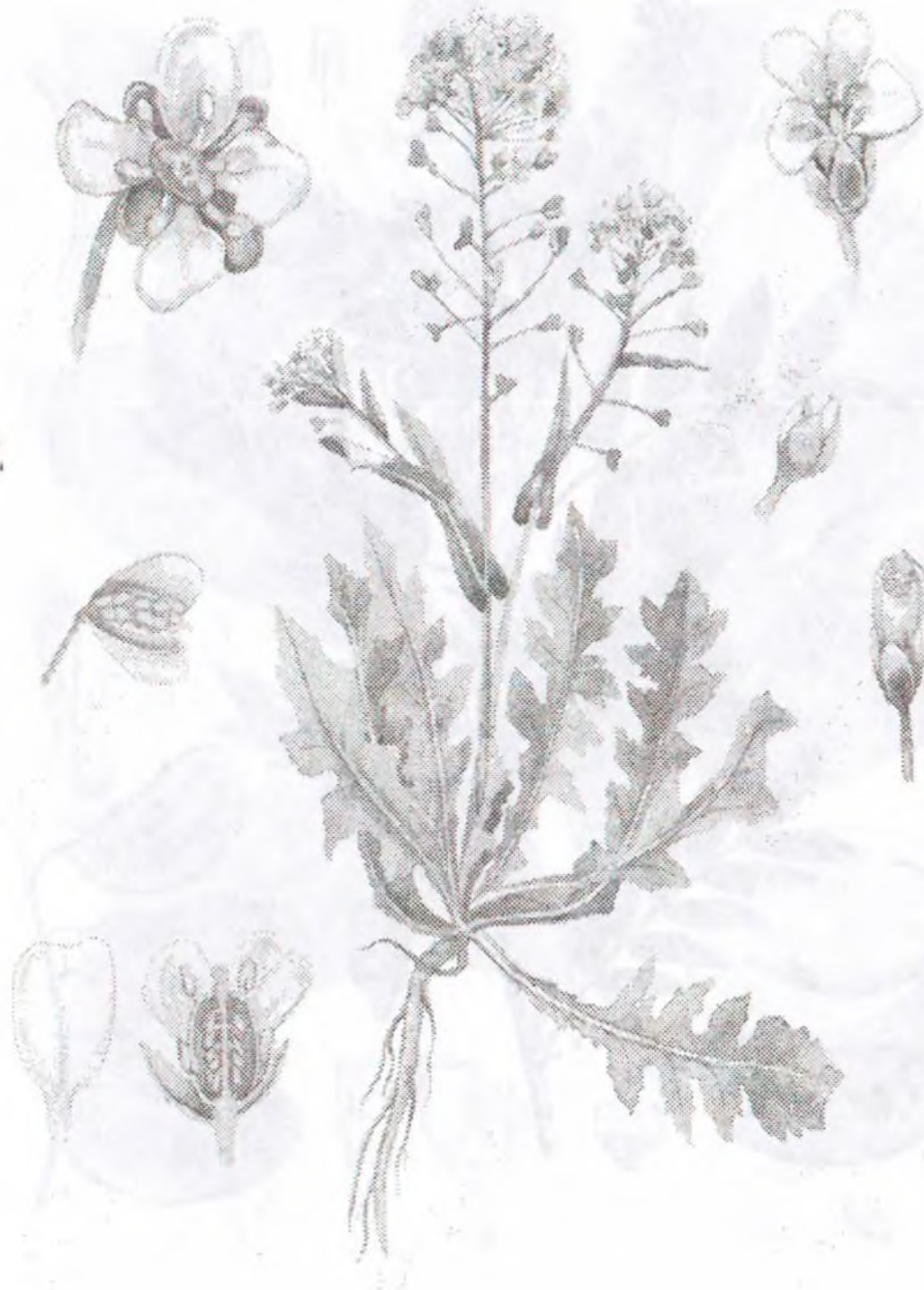
Capsella bursa pastoris (L.) Medic.