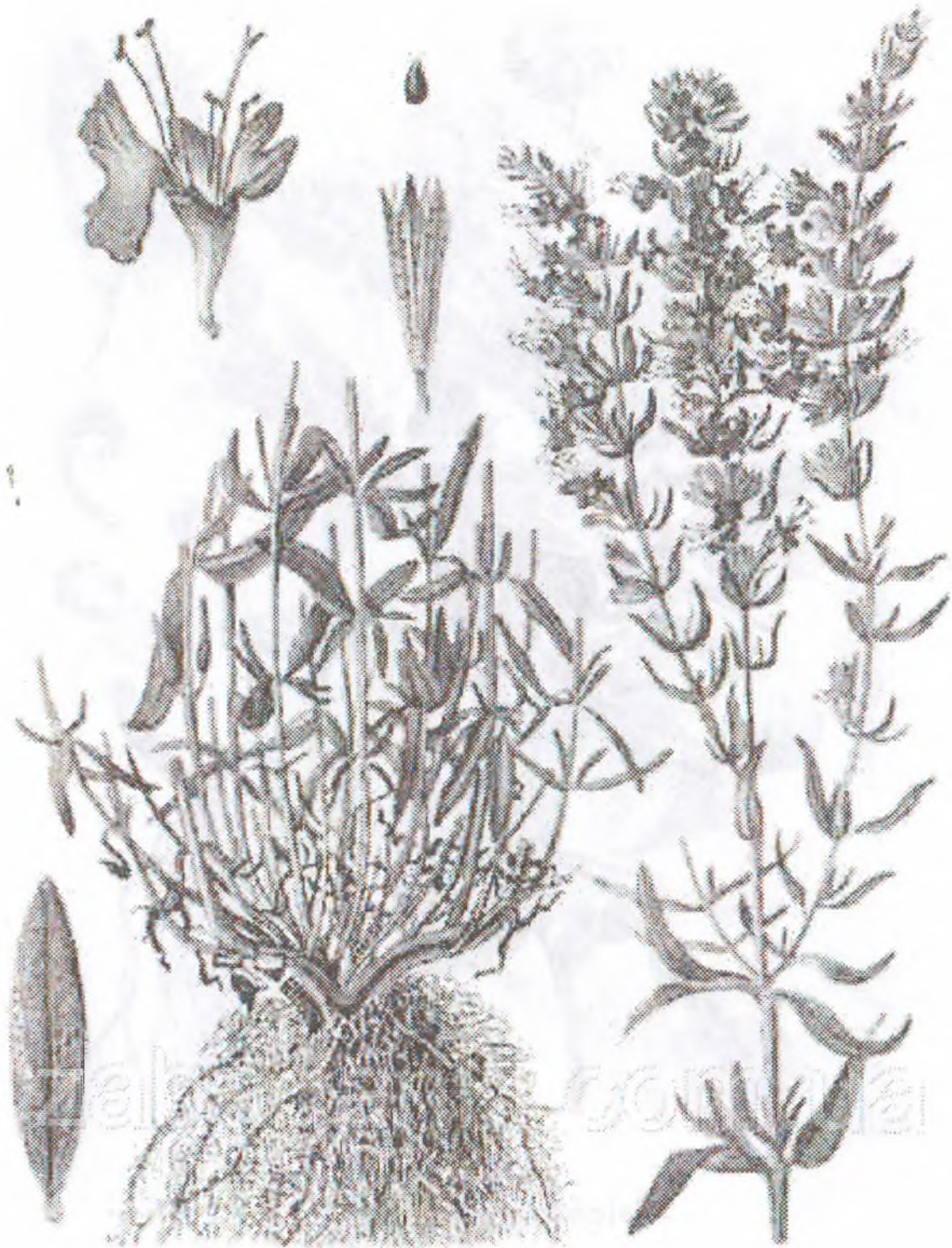
Hyssopus officinalis L.