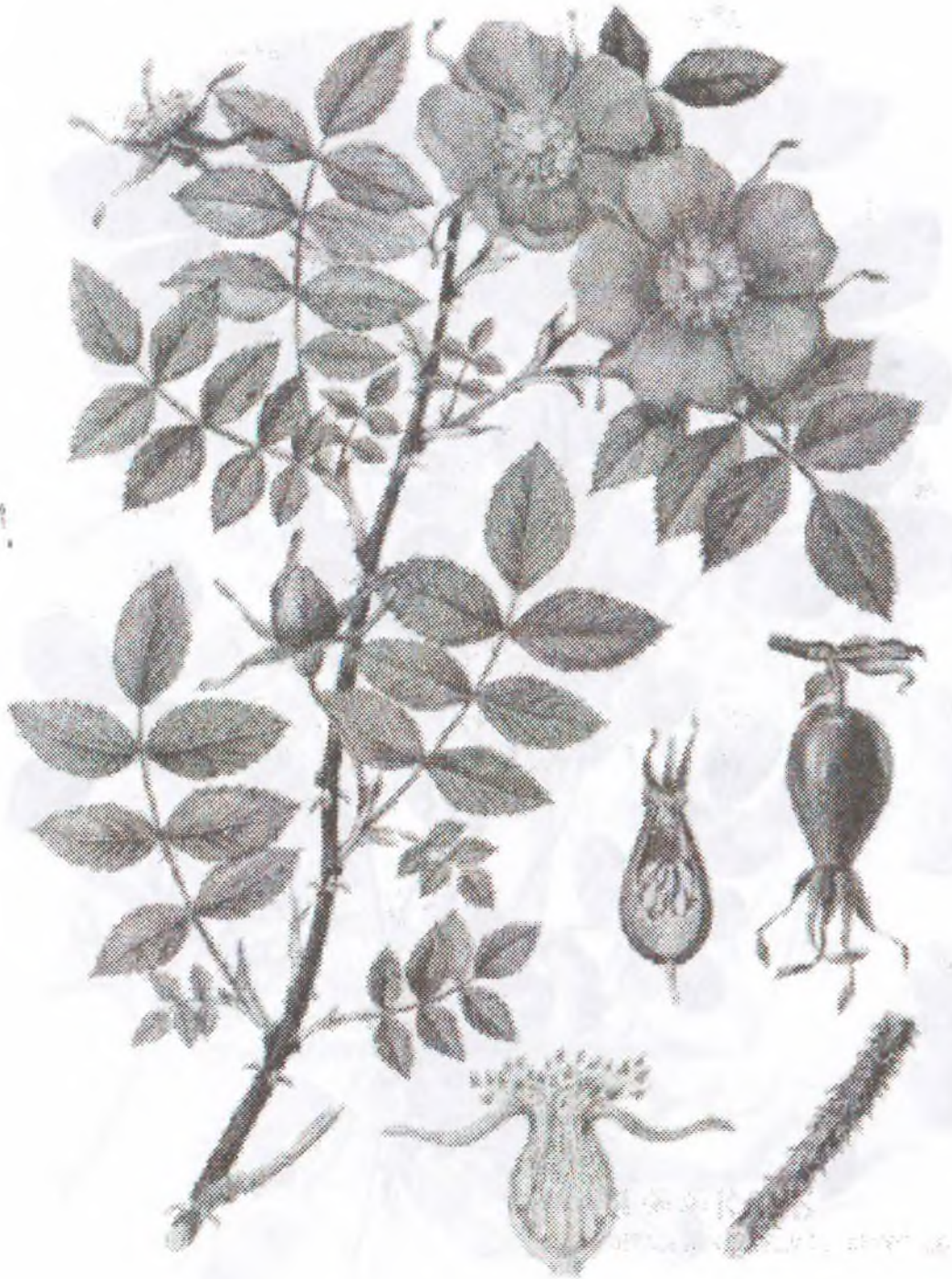
Rosa cinnamomea L.