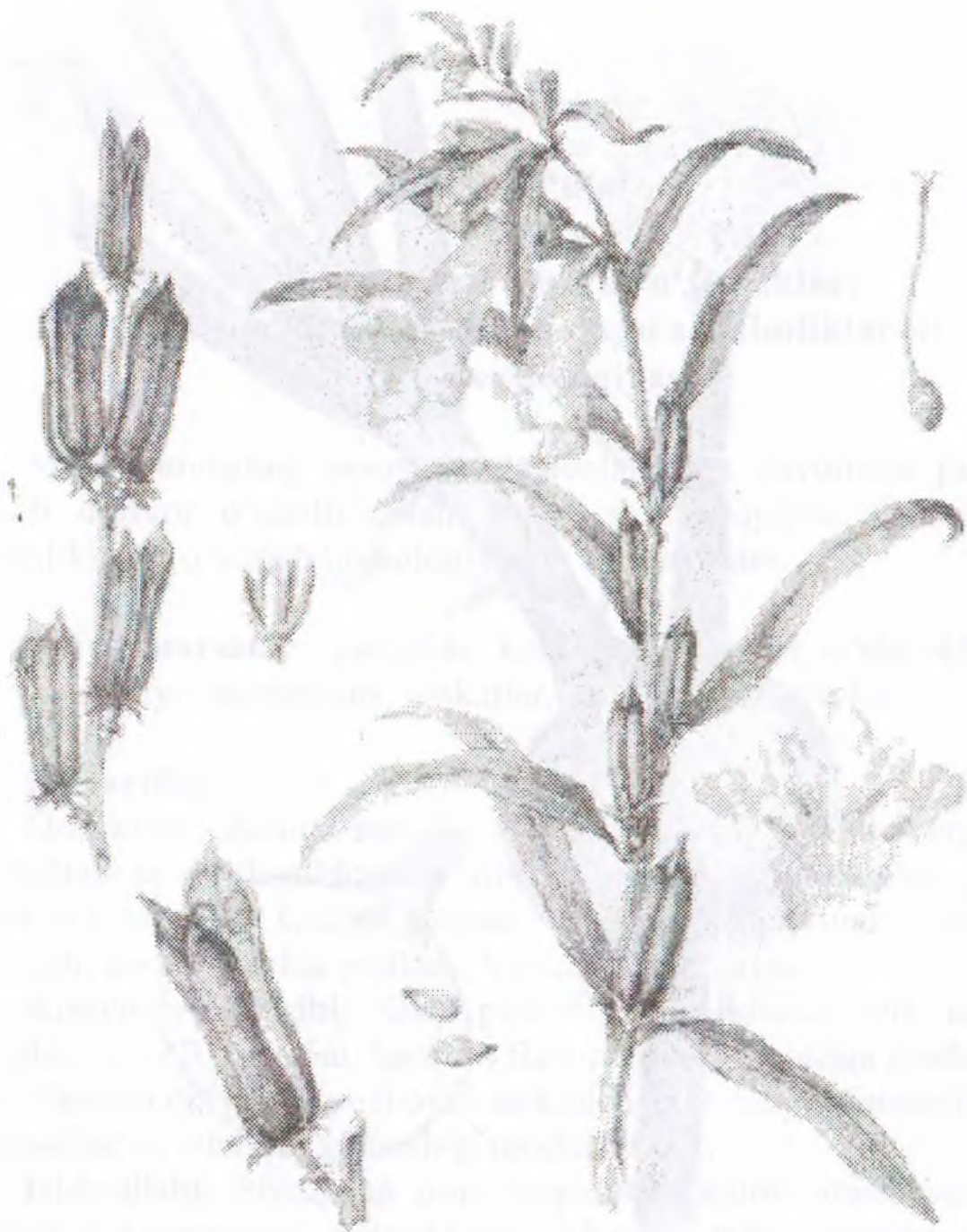
Sesamum indicum L.